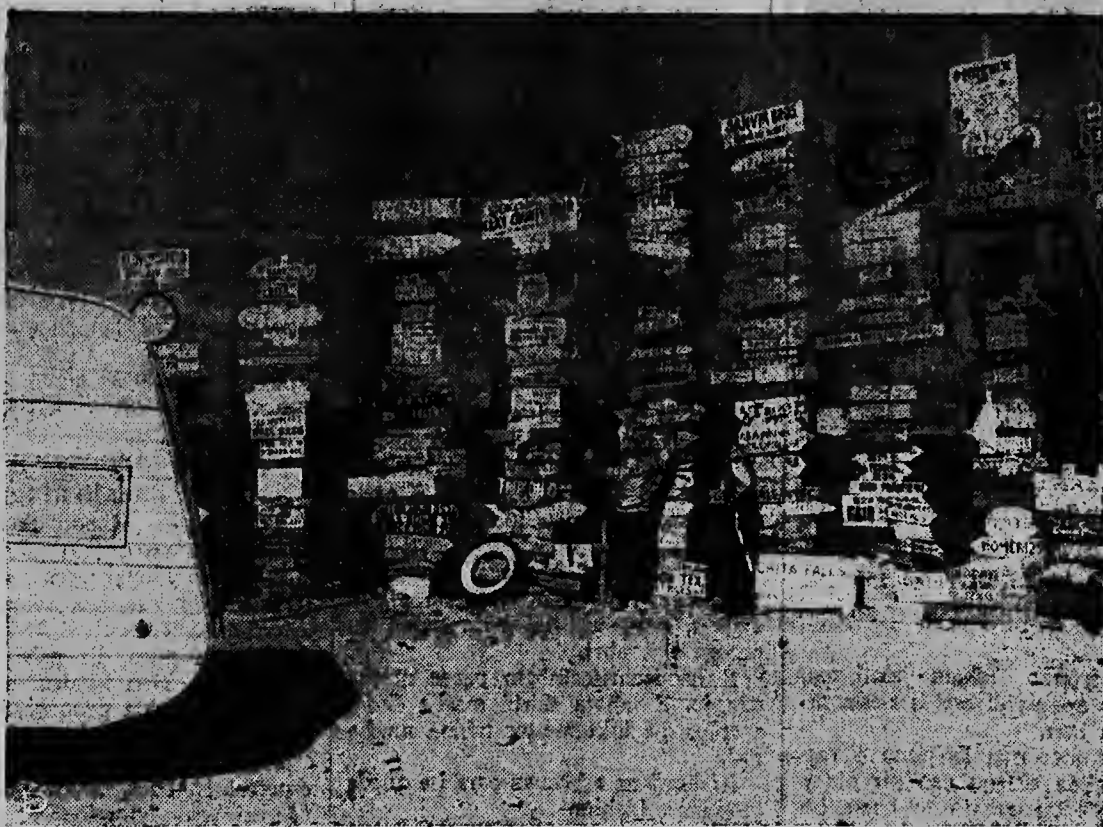
E hombra ei riba e foto justamente ta poniendo di 301 gui na e cruso di caminda na Watson Lake, banda caminda grandi di Alaska. Masha facil en caso cu bo perde caminda un cruso ilustra asina ei. A.N.W.B. ta en comparacion cu esaki ainda un principiante.